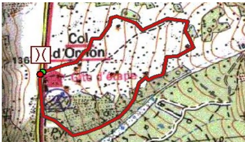
Circuit R2 : longueur : 2 km, dénivelé : 100 m Durée : 40 mn à 1 h 10 Remarque : début commun avec R1 jusqu'à l'altitude 1450 m